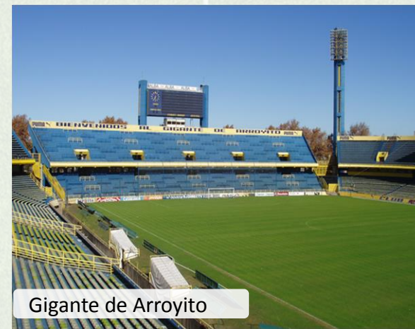
Gigante de Arroyito