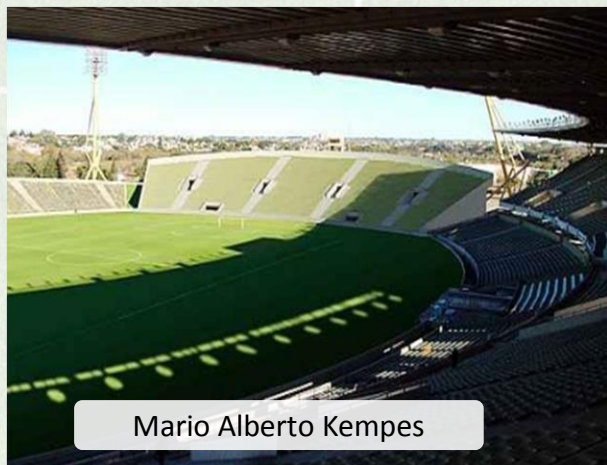
Mario Alberto Kempes